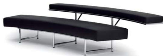
MONTE CARLO 1929