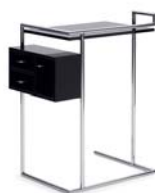
PETITE COIFFEUSE 1929